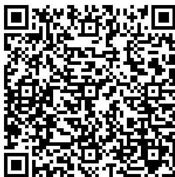
万方数据 app 扫码